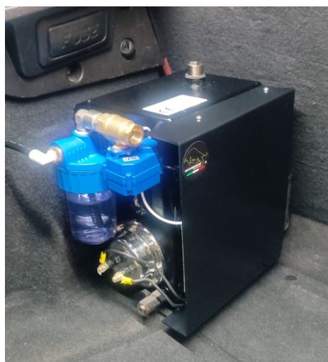
VERSIONE SEMPLICE O 4.0

Grazie alla tecnologia HydroMaverich e al gps integrato, l' impianto va in funzione solo quando serve e varia la quantità di idrogeno per ottimizzare tutti i giri del motore diminuendo ulteriormente i consumi.