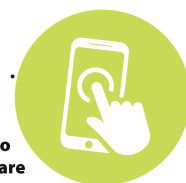
Controllo remoto anche da cellulare