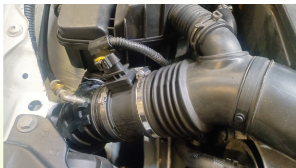
Ugello iniettore idrogeno in aspirazione

EPILOT è un dispositivo di produzione di Idrogeno per trasformare il motore in ibrido ad idrogeno, la sua funzione è di pulire il motore, diventando parte del carburante grazie al flusso continuo immesso in camera di scoppio.